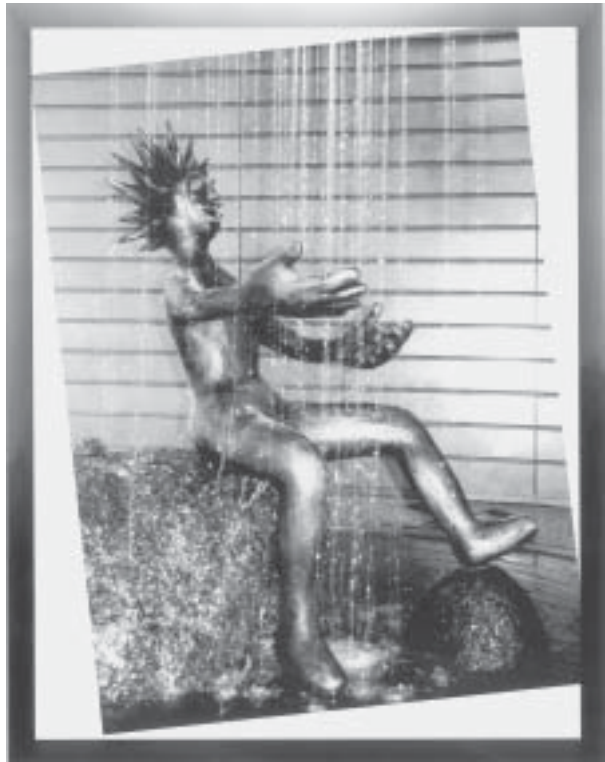
Der warme Regen, Brunnenplastik, Selb, 1997

Zu ihren Bildern sagt Bärbel Kießling: „Ich will Menschen vorwiegend über die Farbe positiv ansprechen, sie anregen, sich mit Fantasie ins Bild einzudenken und sich vielleicht darin wiederzufinden...“. Horst Kießling meint zu seiner Kunst: „Ich greife häufig menschliche Lebenssituationen auf und setze sie bildnerisch (oft in Bildserien) abstrahiert um. Betrachtende sollen angeregt werden, die zweite, tiefere Ebene der Darstellung zu entdecken mit Muße ohne Zeitdruck, Hektik, Verpflichtungen und Konvention: Muße für Kunst “.